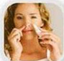
Промывание носа солевым раствором