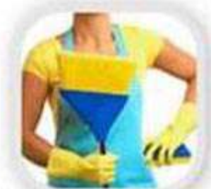
Влажная уборка помещения